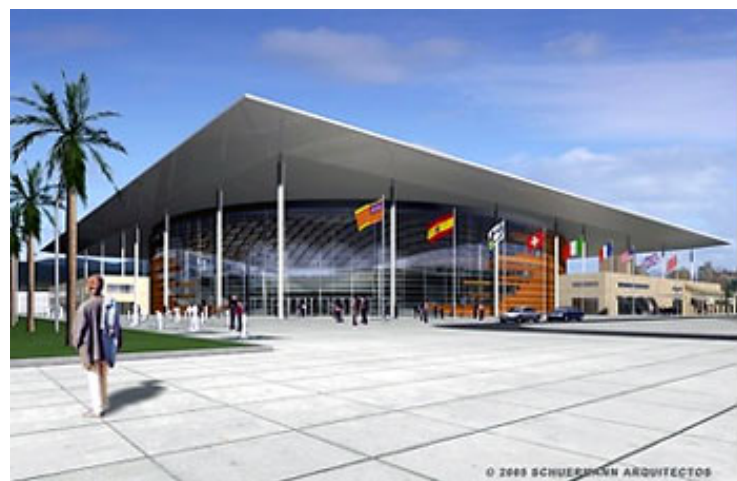
So soll das Schmuckkästchen laut Planung schon in wenigen Wochen aussehen.

Mallorca gilt als die Insel der Ruhe, und vielerorten wird bis nach Dreikönige nicht besonders viel gearbeitet. Doch im Palmesaner Stadtviertel Sant Ferran gibt es eine Großbaustelle, auf der Tag und Nacht gleich mehrere dutzend Arbeiter fleißig sind, auf der ein ständiges Kommen und Gehen von schweren Lkws herrscht. Mit Hochdruck wird das neue Velodrom fertig gestellt – und dieser Hochdruck ist auch nötig, wenn die neue Rad-Halle im Februar eingeweiht werden soll. Schließlich soll vom 29. März bis 1. April dort die Bahn-Rad-WM stattfinden.