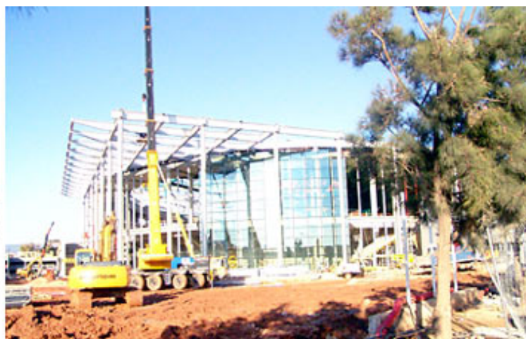
Aber noch braucht man für diese Vorstellung eine ganze Menge Phantasie. Das Foto ist am 29. Dezember entstanden, im Februar soll Einweihung sein.

Nervös wird auf Mallorca trotzdem keiner. „Wir werden ganz sicher fertig“, sagt Pepote Ballester, balearischer Staatssekretär für Sport kurz vor Weihnachten. Auf der Insel wird vielleicht nicht alles hundertprozentig perfekt gebaut, aber wenn es sein muss in einem Affenzahn. Man erinnert sich gerne an die Expo in Sevilla 1992: Die Zufahrtsstraße wurde – schon legendär – am Tag vor der offiziellen Eröffnung asphaltiert.