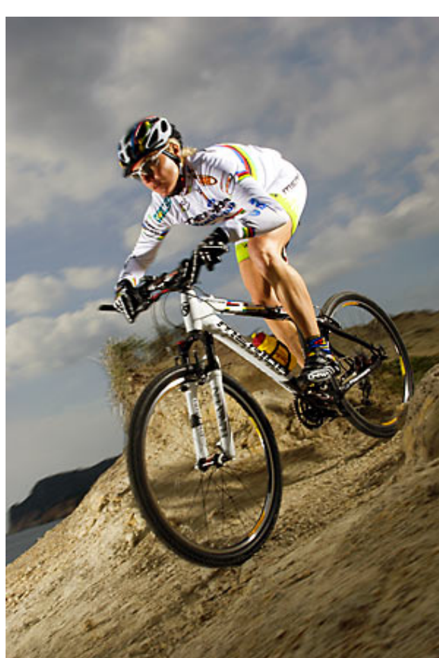
MTB-Top-Star Gunn-Rita Dahle Flesjå trainiert in diesem Jahr drei Wochen bei Philipp's Bike Team