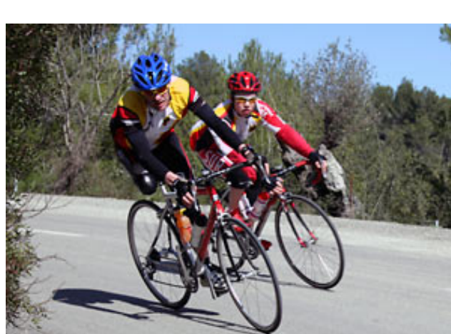
Die deutsche Nationalmannschaft der Behinderten kommt im Februar zum Trainingslager nach Mallorc

Während die Rennfahrer fest definierte Saisonziele haben, fehlen die uns Hobbyfahrern mitunter. Deswegen mein Vorschlag: Macht mit Philipp's Bike Team bei den Cyclassics in Hamburg mit. Der Termin am 19. August ist jetzt endgültig bestätigt; anmelden kann man sich ab dem 23. Januar. Wer keine Gelegenheit hat, an der Waterkant dabei zu sein, der sollte mal unsere Events genauer angucken: Die Pyrenäenfahrt sowie die Fernfahrt Paris-Nizza-Rom sind echte Höhepunkte in jedem Radlerleben.