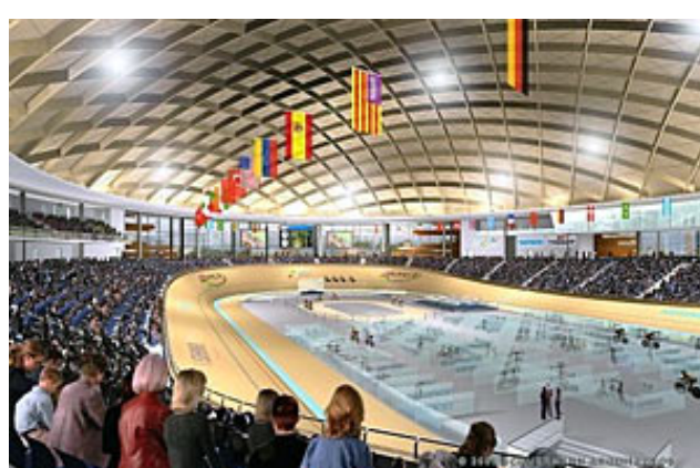
250 Meter Holz-Oval – auch nach der WM sollen die Bahn für Profis und Hobbyfahrer gleichermaßen zugänglich gemacht werden.

Wenn denn alles klappt, werden die Rennfahrer auf einem 250 Meter langen Holz-Oval fahren. Das wird übrigens nicht abgebaut, sondern soll laut Ballester ständig in Betrieb bleiben. Es ist vorgesehen, die Bahn nicht nur für das Training von Profis zugänglich zu machen, sondern auch für Radler wie Dich und mich. Das könnte also eine echte Attraktion auch für Urlauber werden, aber noch wissen wir nicht, unter welchen Bedingungen der Eintritt geregelt ist. Wir halten Euch auf jeden Fall auf dem Laufenden.