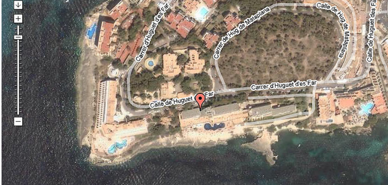
So sieht das neue Hotel aus der Vogelperspektive aus: Standortbestimmung mit Google-Earth.

Währenddessen sind die Handwerker im Iberostar Suites Hotel Jardín del Sol fleißig. Man kann schon erkennen, wie es mal werden soll, und vor allem kann man erkennen, dass die Radinfrastruktur so sein wird, dass es für Gäste, aber auch für das Team, sehr praktisch werden wird.