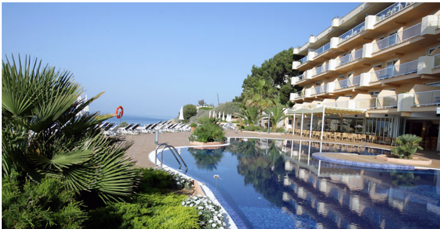
Sonnige Impression von Iberostar Suites Hotel Jardín del Sol, wo gegenwärtig die Radinfrastruktur von Philipp's Bike Team eingebaut wird.

Wenn die Saison am 3. Februar 2007 starten wird, gibt es also ein neues Highlight für Radferien auf Mallorca. Das haben viele von Euch schon gebucht - unsere Reisebüros können sich über mangelnde Arbeit wahrlich nicht beklagen. Die Preise sind in dieser ganz besonderen Saison - die erste an neuen Standort, gleichzeitig die zehnte insgesamt - auch besonders attraktiv. Für all diejenigen, die noch nicht sicher sind, wann denn eine gute Zeit wäre, hier eine kleine Entscheidungshilfe: Am 11. Februar startet die Mallorca-Rundfahrt, mit der die meisten Profis traditionell die europäische Saison einläuten. Das ist übrigens eine Woche später, als das in den letzten Jahren war.