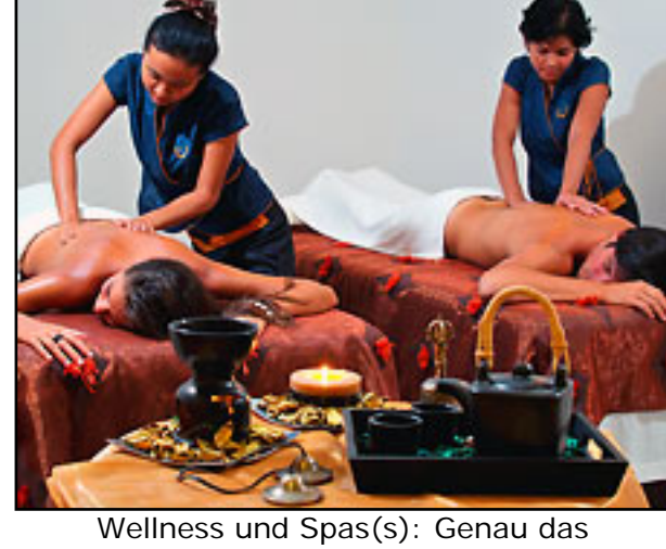
Wellness und Spas(s): Genau das Richtige auch für Partner oder Partnerinnen, die nicht jeden Tag Rad fahren.

Bei einer traditionellen Royal-Thai-Massage fühlt man sich hinterher garantiert königlich, und beim Mirror of Heaven, einer Vier-Hände-Massage, fühlt man sich hinterher sicher wie im siebten Himmel. Es gibt aber auch ayurvedische oder hawaiianische Lomi-Lomi-Massagen. Direkt am Mittelmeer gelegen, spielt das Wasser auch im Thai Zen SPaCe eine große Rolle. Die nassen Erlebnisse heißen zum Beispiel Mandi Susu Bad (kommt aus Java) oder Balinesisches Blütenbad. Da mutet der Thermal-Rundlauf fast schon klassisch an. Da wahre Schönheit zwar in erster Linie, aber nicht nur von innen kommt, bieten die Wellness-Mitarbeiterinnen des Hotels auch Body-Scrubs und –Wraps sowie kosmetische Gesichtsbearbeitungen an. Die ausgebildeten Spezialistinnen sind übrigens durch den Tempel Wat Po in Bangkok zertifiziert, und verfügen über viel Erfahrung auf dem Gebiet der traditionellen asiatischen Gesundheitsphilosophie.