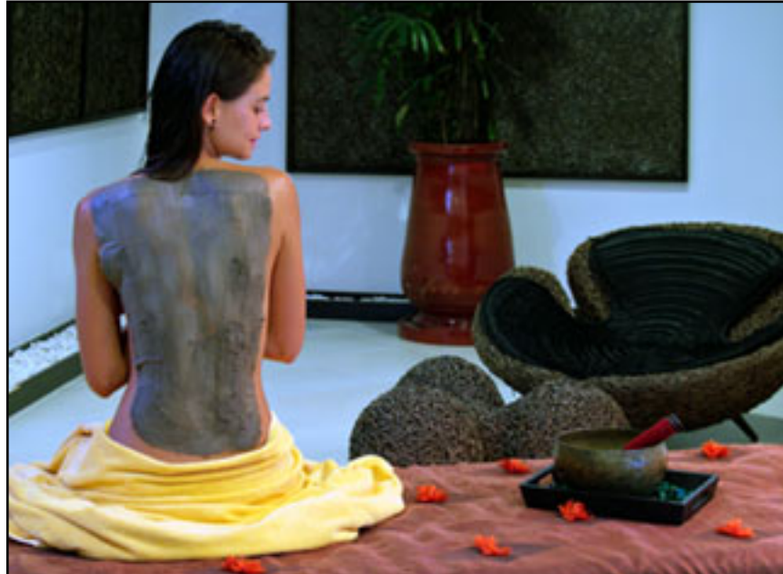
Neben verschiedenen Massagen und Bädern gibt es auch Body-Scrubs und –Wraps.