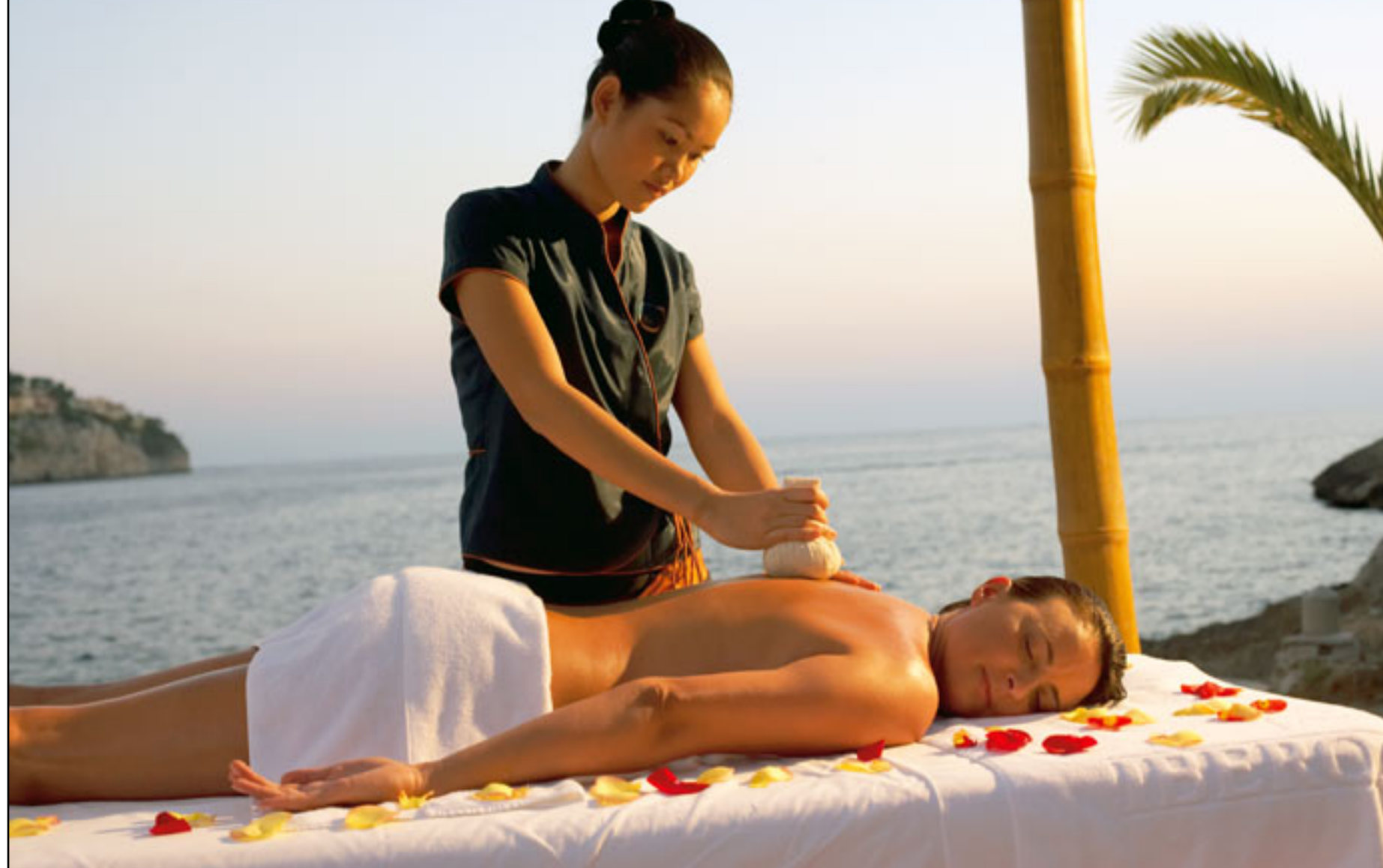
Entspannung pur: Der Thai-Zen SPaCe im Iberostar Suites Hotel Jardín del Sol, dem neuen Club-Standort von Philipp's Bike Team.