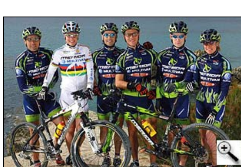
Das Multivan Merida Biking Team mit den Weltmeistern Gunn-Rita Dahle Flesjå und Ralph Näf beim Trainingslager auf Mallorca.