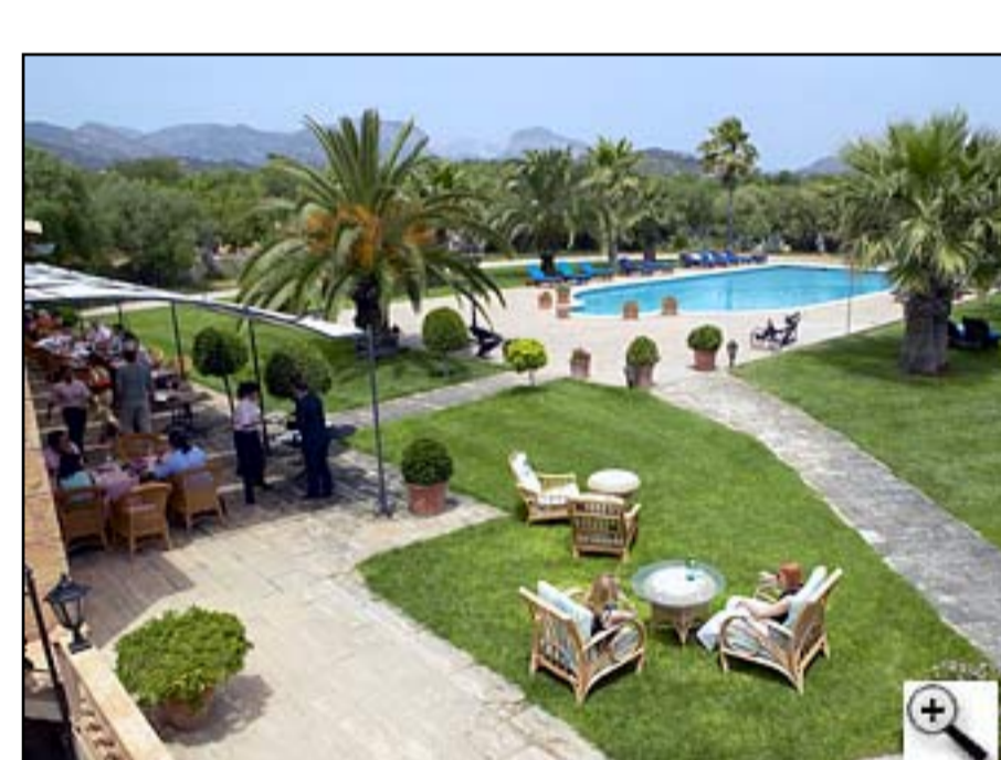
Luxusunterkunft mit Stern-Restaurant: das Hotel Read's bei Santa Maria.

Wer nicht in der Gruppe fahren will und keinen Wert auf Team-Betreuung legt, muss in unseren neuen, besonderen Unterkünften dennoch nicht auf Service rund ums Rad verzichten. Etwa bei Finca & Fahrrad , erstmals bei Philipp's Bike Team im Programm. Ob in der Posada d'es Moli in Es Pillari oder dem Hotel Read's bei Santa Maria, beide Landherbergen sind richtig für Gäste, die abseits der Ferienorte komfortabel bis luxuriös unterkommen wollen. In Preis enthalten ist das Mietrad mit Versicherung. In Preis enthalten ist das Mietrad mit Versicherung, das heißt, wenn an dem Rad etwas ist, bleibt der Gast nicht auf sich allein gestellt, sondern wir kümmern uns darum. Und das bisherige Clubhotel Sol Antillas bleibt uns als Station erhalten, die gute Infrastruktur und ein Stationsleiter sorgen für sorglose Radferien.