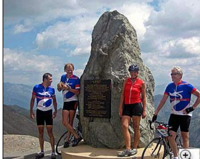
Die Fernfahrer auf dem Cime de la Bonette, der höchsten Passstraße Europas.