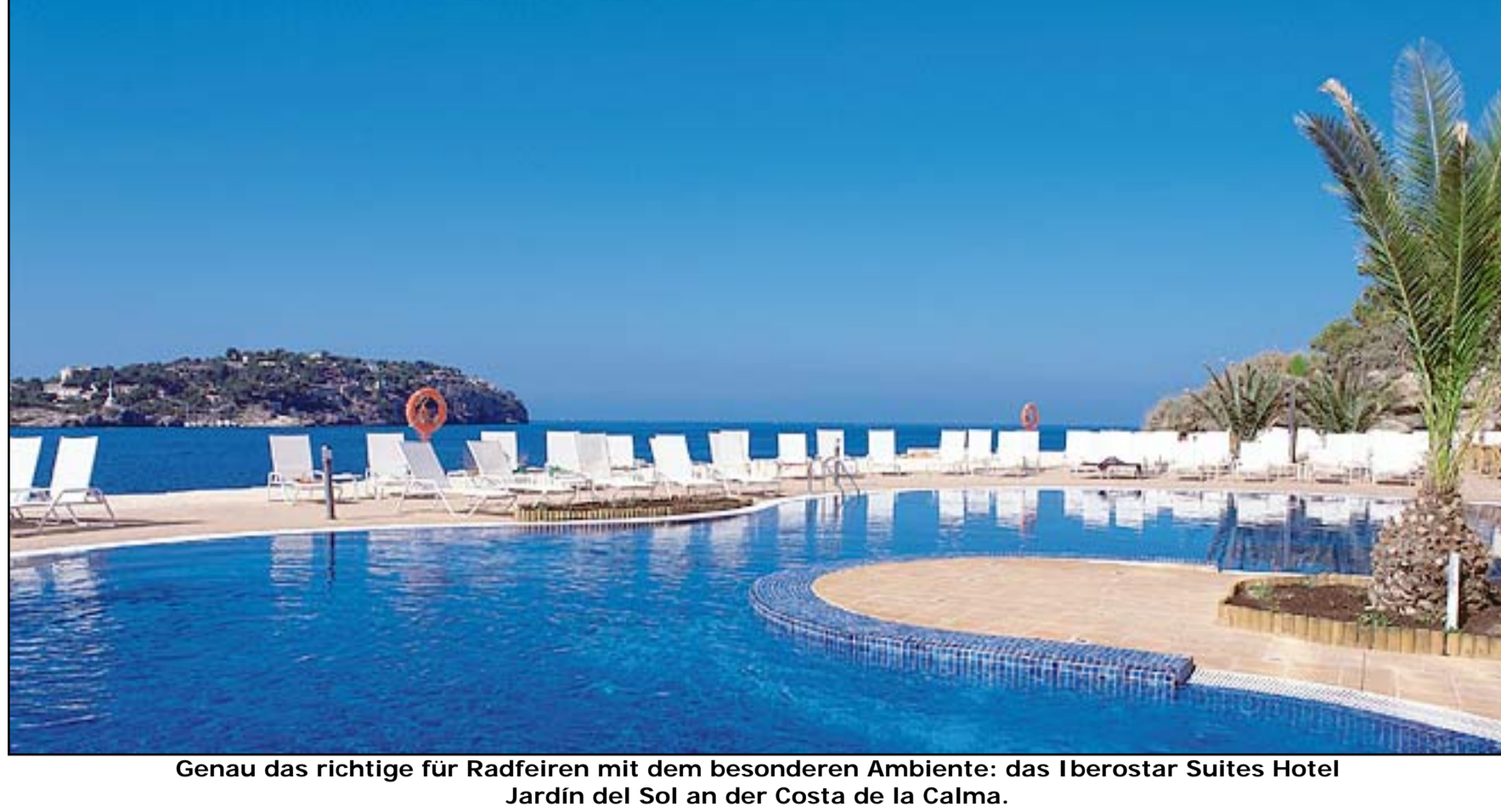
Genau das richtige für Radferien mit dem besonderen Ambiente: das Iberostar Suites Hotel Jardín del Sol an der Costa de la Calma.