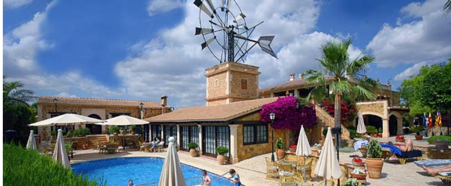
Neu im Programm: Die Posada d'es Moli in Es Pillari in der Nähe der Playa de Palma.