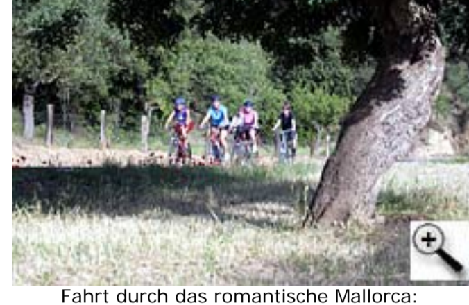
Fahrt durch das romantische Mallorca: Radwanderer haben Zeit – und mit Hilfe eines Busses kommen sie auch zu den Stellen, die sonst unerreichbar scheinen.