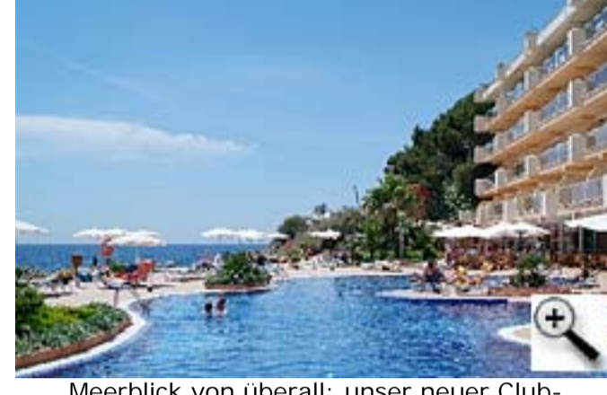
Meerblick von überall: unser neuer Club-Standort, das Iberostar Suites Hotel Jardín del Sol an der Costa de la Calma.