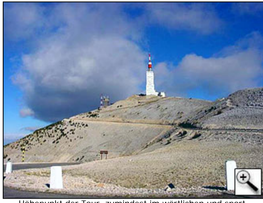
Höhepunkt der Tour, zumindest im wörtlichen und sportlichen Sinne: der legendäre Mont Ventoux.