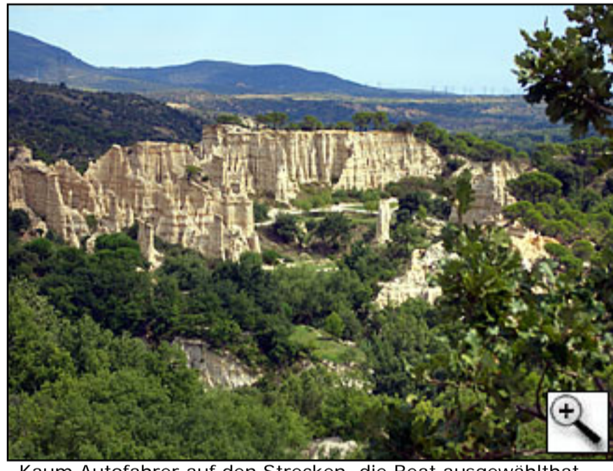
Kaum Autofahrer auf den Strecken, die Beat ausgewählt hat – aber dafür umso mehr Natur und solche bizarren Felsformationen.