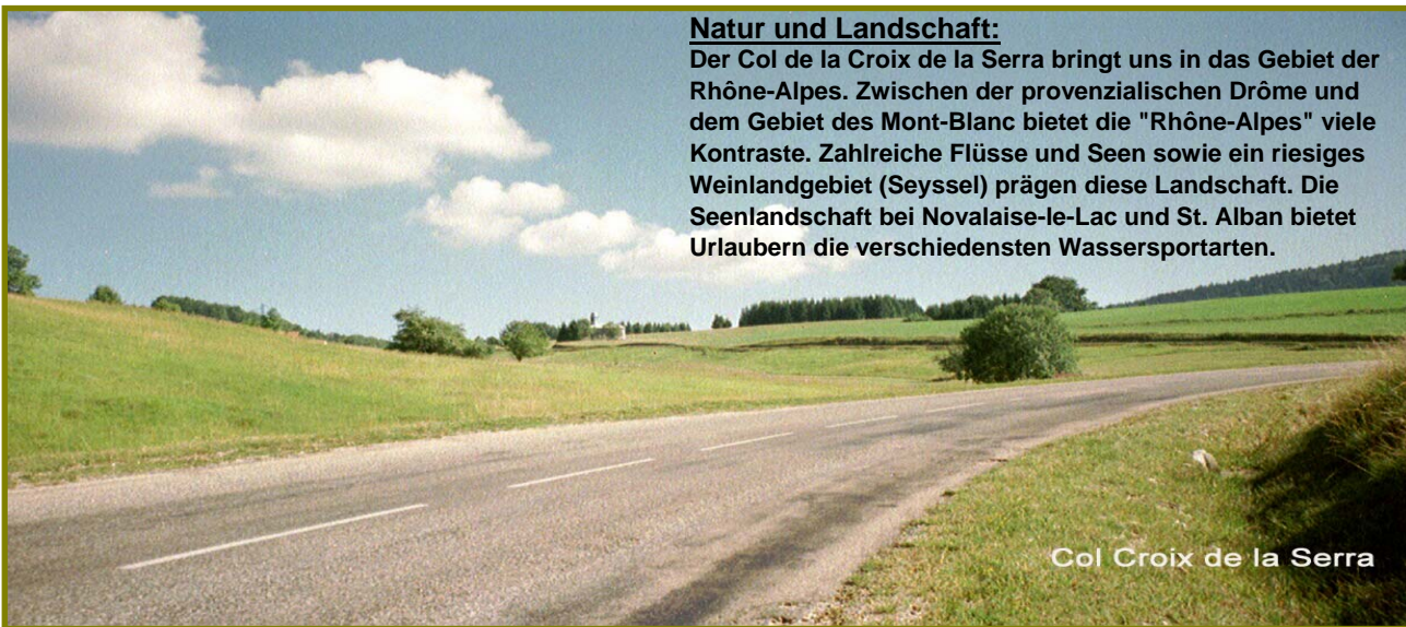
Col Croix de la Serra

Der Col de la Croix de la Serra bringt uns in das Gebiet der Rhône-Alpes. Zwischen der provenzalischen Drôme und dem Gebiet des Mont-Blanc bietet die "Rhône-Alpes" viele Kontraste. Zahlreiche Flüsse und Seen sowie ein riesiges Weinlandgebiet (Seyssel) prägen diese Landschaft. Die Seenlandschaft bei Novalaise-le-Lac und St. Alban bietet Urlaubern die verschiedensten Wassersportarten.